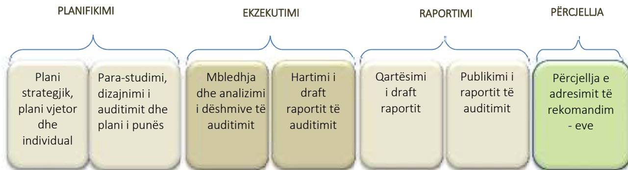
Grafiku 1: Fazat e procesit të auditimit të performancës

Faza 1. Planifikimi. Përfshinë propozimin e temave për auditim dhe përgatitjen e memove parastudimore. Propozimet shqyrtohen përmes një procesi vlerësues lidhur me përshtatshmërinë dhe rëndësinë e temës për t'u audituar. Në këtë fazë poashtu, ekipet e auditimit bëjnë një hulumtim më të thellë rreth temës përkatëse, ku përcaktohen: problemi i auditimit, objektivat e auditimit, motivi i auditimit, fushëveprimi i auditimit, etj.